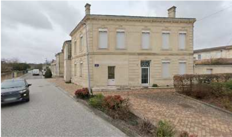
1, place G Lombole