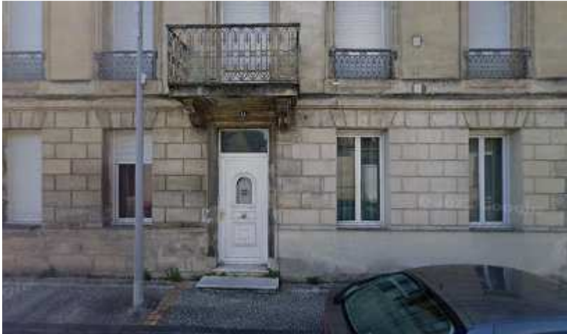
52, av Libération