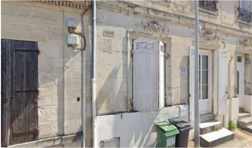
93, av Libération