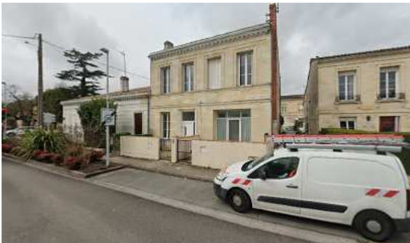
128, av Libération