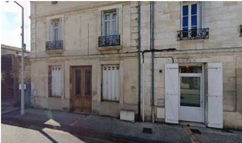
40, av Libération