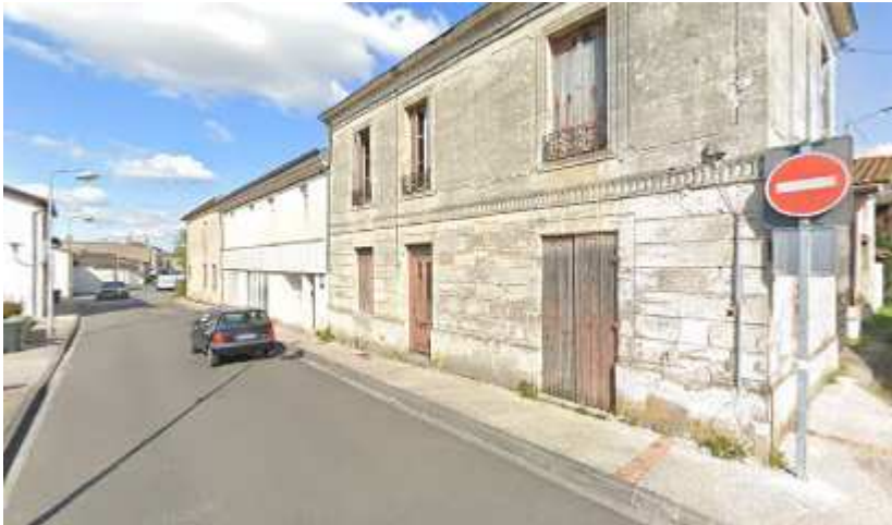
65, av Libération