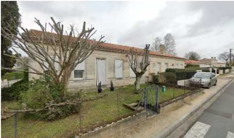
17, 19 rue Parenteau