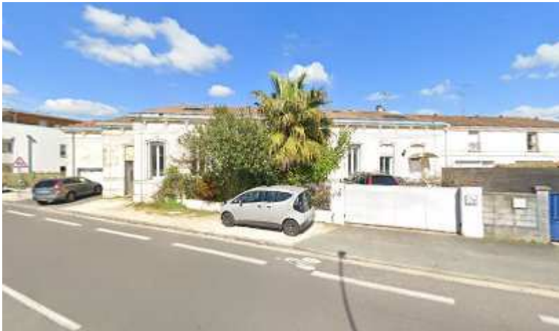
223, av Taillan M